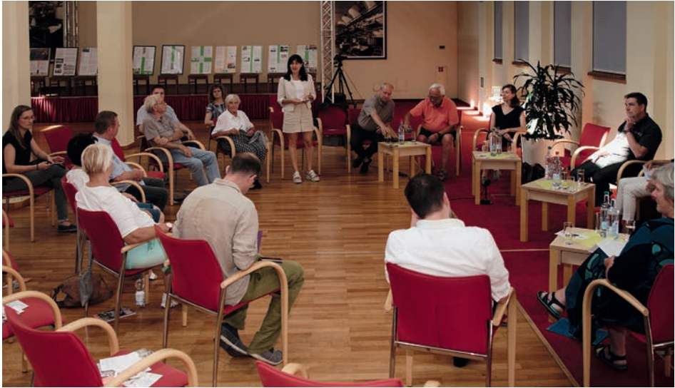
3. Erzählalon am 26. August 2022 in der Alten Färberei