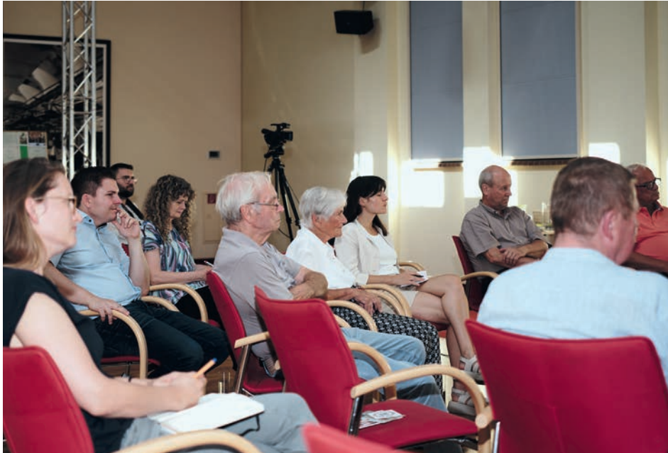
Zuhörende, 3. Erzählalon am 26. August 2022 in der Alten Färberei

Eines meiner Enkelkinder wohnte in Hamburg, Karlsruhe und Freiburg – mit Besuchen dort kam ich viel herum. Überall fällt mir das Zusammenleben der Generationen auf. Jung und Alt sitzen zusammen in den Gaststätten oder bei Konzerten. Das kenne ich aus Guben nicht. Mehr junge Leute und alle Generationen gemeinsam ins gesellschaftliche Leben einzubeziehen, finde ich äußerst wichtig, und es würde mich freuen, wenn das mehr gelingen würde.